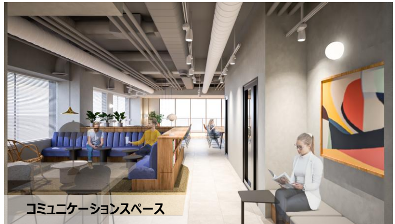
コミュニケーションスペース