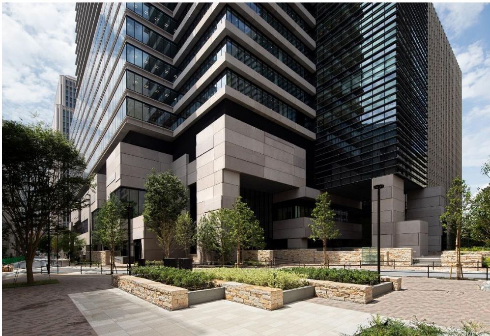
<日比谷フォートタワー外観>

当社が参画する新橋田村町地区市街地再開発組合が進めている大規模再開発プロジェクト「日比谷フォートタワー」(プロジェクト名称:新橋田村町地区市街地再開発事業)が6月30日に竣工しました。本オフィスビルは芸術・文化を発信する街「日比谷」、官庁や政府系機関が集積する街「霞が関」、国際色豊かなオフィス街「虎ノ門」、活気に満ちた賑わいの街「新橋」という主要エリアの結節点に位置します。